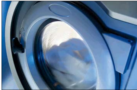
Porta de amplo ângulo de abertura..

Modelos de lavadoras eléctricas com capacidade entre 7,5 e 18 kg