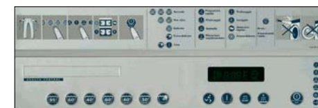
Painel de controlo.

Modelos de lavadoras centrifugadoras com capacidade entre 5,5 e 18 kg. 7 programas de lavagem com 4 opções (roupas pouco sujas, muito sujas, sem centrifugação e enxaguamento adicional) e um temporizador electrónico