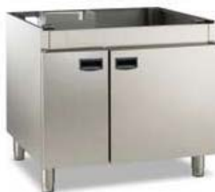
Armário base fechado para fornos 6 e 10 GN 1/1