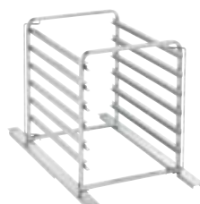
Estrutura rodada para fornos 6 GN, com passo de 63 mm ou de 80 mm