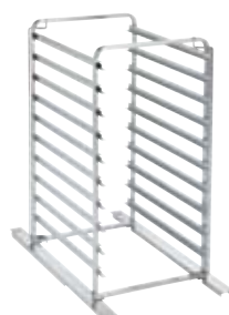
Estrutura rodada para fornos 10 GN 1/1 ou fornos 10 GN 2/1, com passo de 65 mm ou de 80 mm