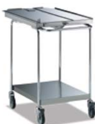
Carro para estrutura, rodado, para fornos 10 GN 2/1