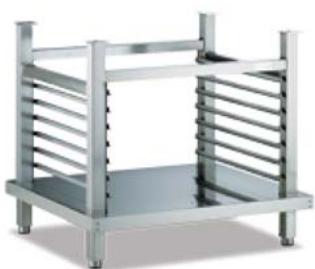
Estrutura base com apoio para tabuleiros para fornos 6 e 10 GN 1/1