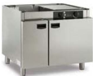
Armário base estufa com humidificador para fornos 6 e 10 GN 1/1