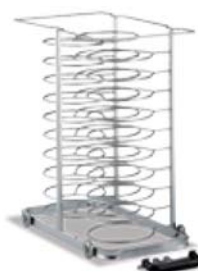
Estrutura para 29 pratos para fornos de 10 GN 1/1